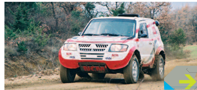
Pour assurer la réussite et la confidentialité de vos essais, ces circuits sont situés dans des endroits calmes et éloignés des habitations. Un gardiennage est assuré 24h/24 sur l'espace asphalté et à la demande à Monteils. Chacun des sites dispose d'aires de lavage, de salles de réunions, d'un poste de secours et d'une hélisurface.